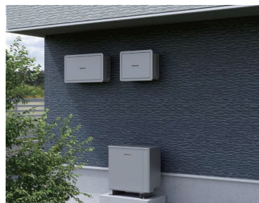
室外蓄電池/コンバータ