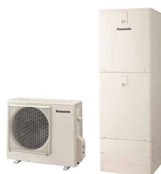
太陽の熱と夜間電力を使って お湯を沸かす。 エコキュート